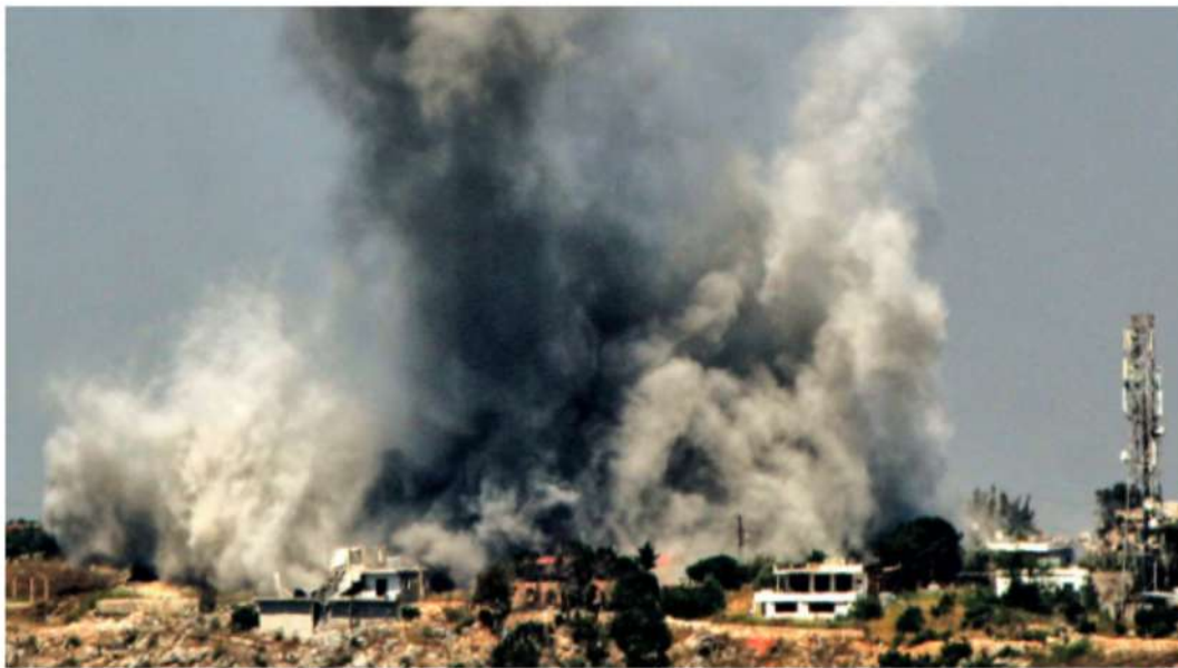
Una columna de humo se eleva sobre el sur de Líbano tras los ataques israelíes de este lunes.