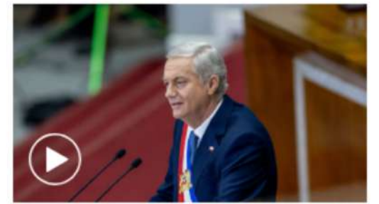
Kast, este lunes.

El candidato presidencial del oficialismo reconoce implícitamente los resultados de las elecciones del domingo, sobre las que el presidente Gustavo Petro había puesto un manto