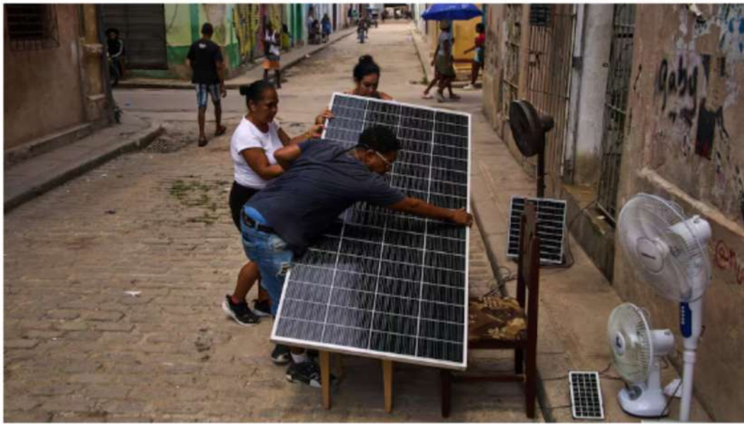
Un grupo de personas prepara un panel solar en una calle de La Habana durante un apagón.

Newsletter Recibe el boletín con todas las novedades del torneo