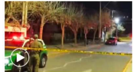
El auto en el que viajaba el niño, este martes.